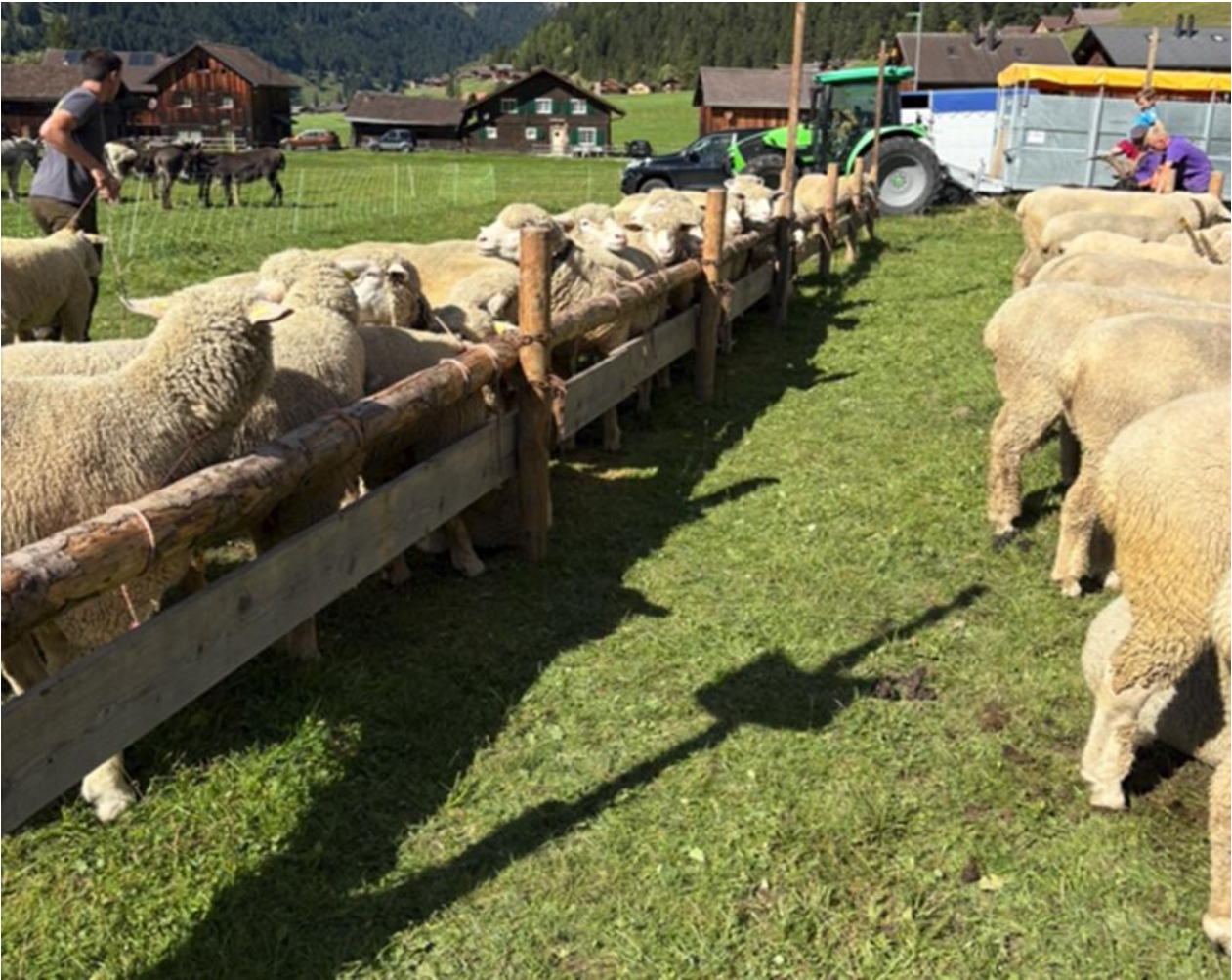
Prämienmarkt Steg 2025